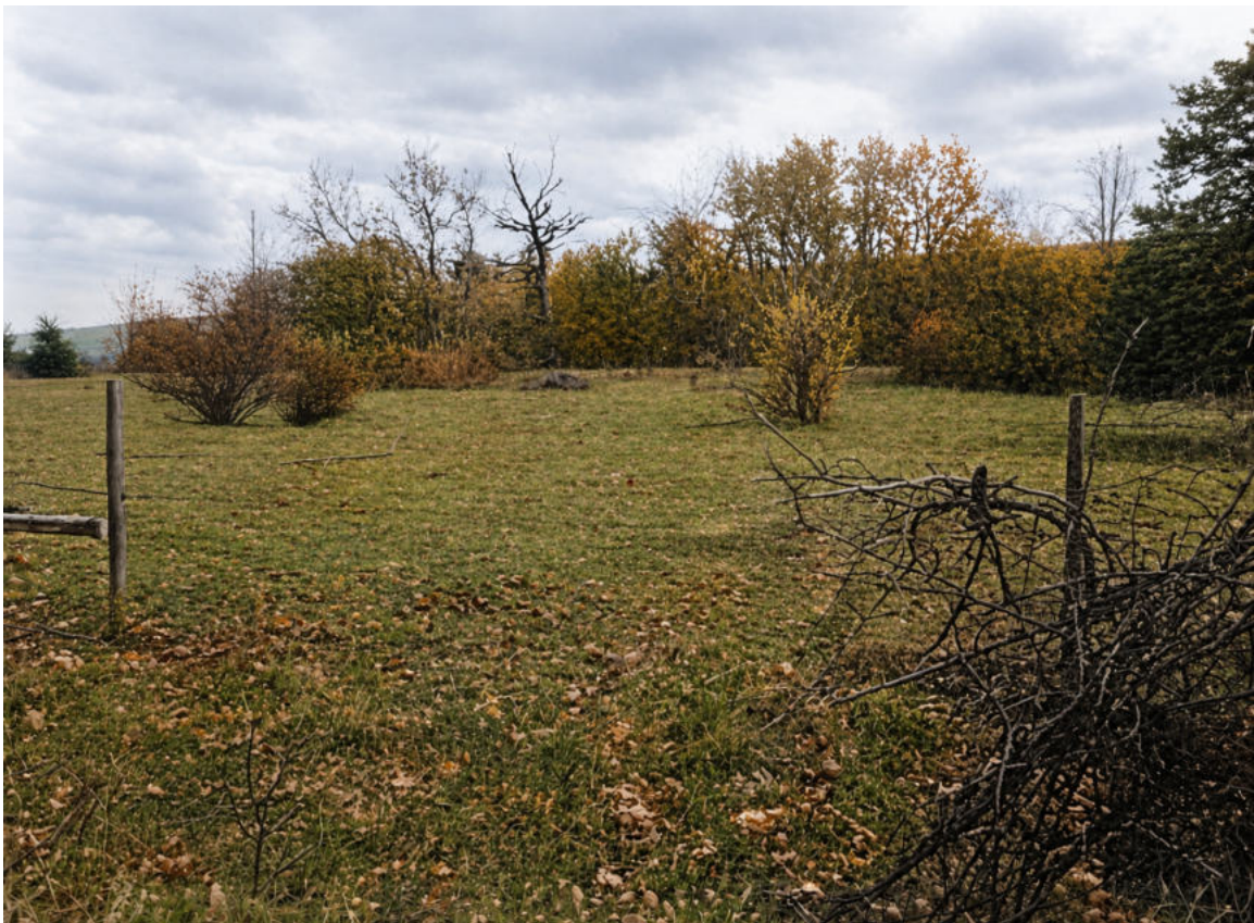
Abb. 2: „Judebaija“ nach der „Einebnung“, 1977